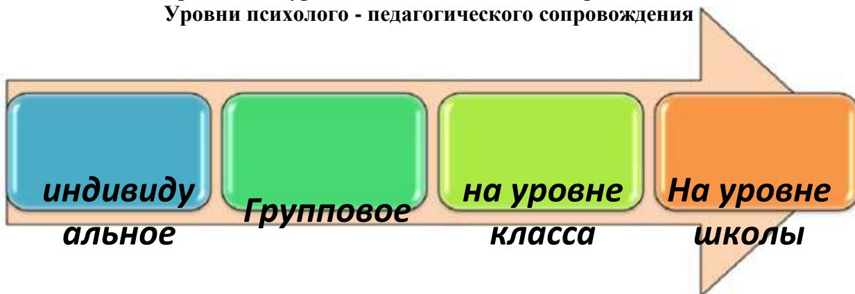
Основные формы сопровождения